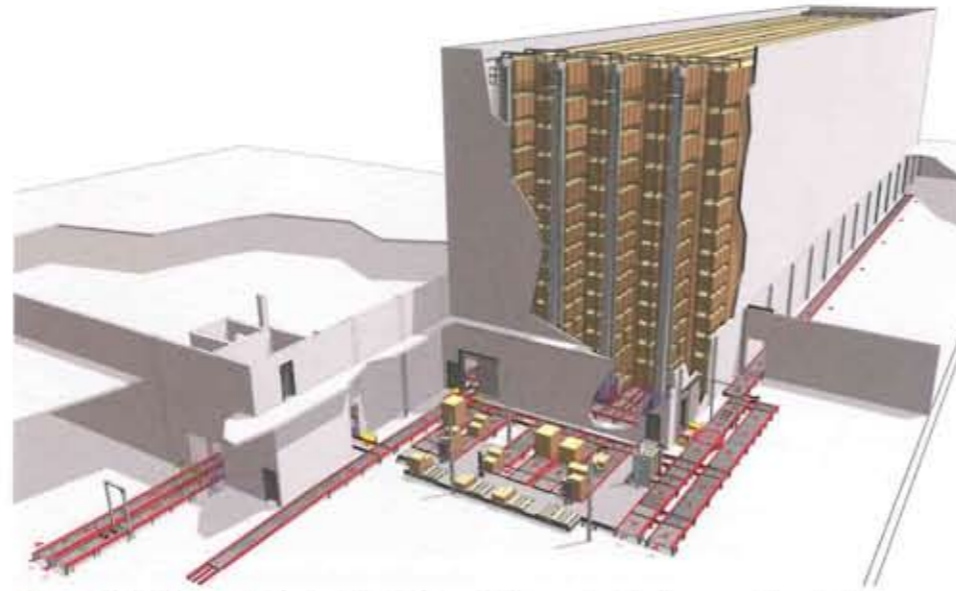
Anfang 2014 ist die neue Sulser-Logistikplattform in Brunegg fit, sich den neuen Herausforderungen zu stellen.