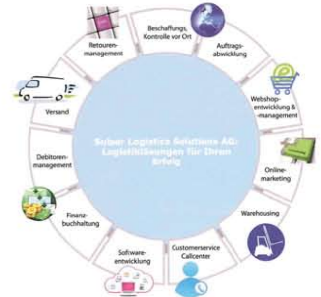
Henrik Petro Das Dienstleistungsportfolio reicht weit über klassische Transport- und Lagerlogistik hinaus.