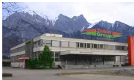
Swiss Logistics Academy AG Ausbildungszentrum Elestastrasse 18 CH-7310 Bad Ragaz / SG Telefon 071 277 40 00 / Fax 044 847 46 88 kursadministration@sulsergroup.ch