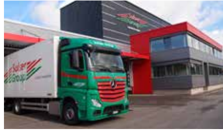
Sulser Logistics Solutions AG / Sulser Transport AG Logistikcenter Brunegg Breitackerstrasse 10 CH-5505 Brunegg / AG Telefon 0844 40 20 40, info@sulsergroup.ch