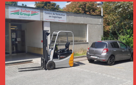
Swiss Logistics Academy AG Centre Formation Av. Préfaully 28-30 CH-1020 Renens / VD Telefon 021 697 40 00

Möchten Sie mehr wissen zum «Grundkurs Lagerlogistik 48 Tage»? Gerne beantworten wir Ihre Fragen persönlich: