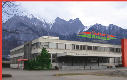
Swiss Logistics Academy AG Ausbildungszentrum Elestastrasse 18 CH-7310 Bad Ragaz / SG Telefon 071 277 40 00