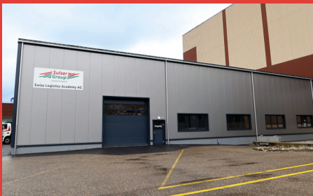
Swiss Logistics Academy AG Ausbildungszentrum Industriestrasse 11b CH-6203 Sempach / LU Telefon 041 322 40 00