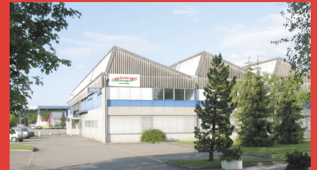
Swiss Logistics Academy AG Ausbildungszentrum Industriering 43 CH-3250 Lyss / BE Telefon 032 384 31 31