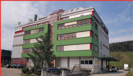
Sulser Logistik AG Hauptsitz Industriestrasse 52 CH-8112 Otelfingen / ZH Telefon 044 847 46 45